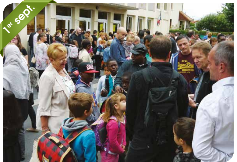
Rentrée scolaire 2015