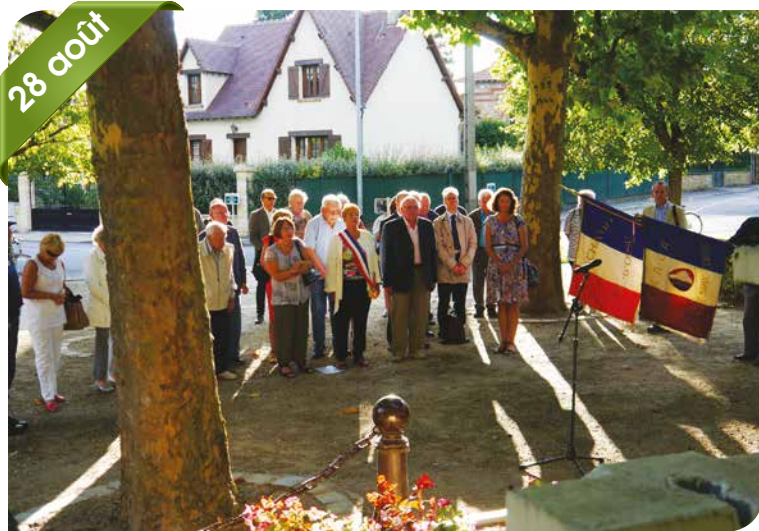
Commémoration - Libération de Beauchamp