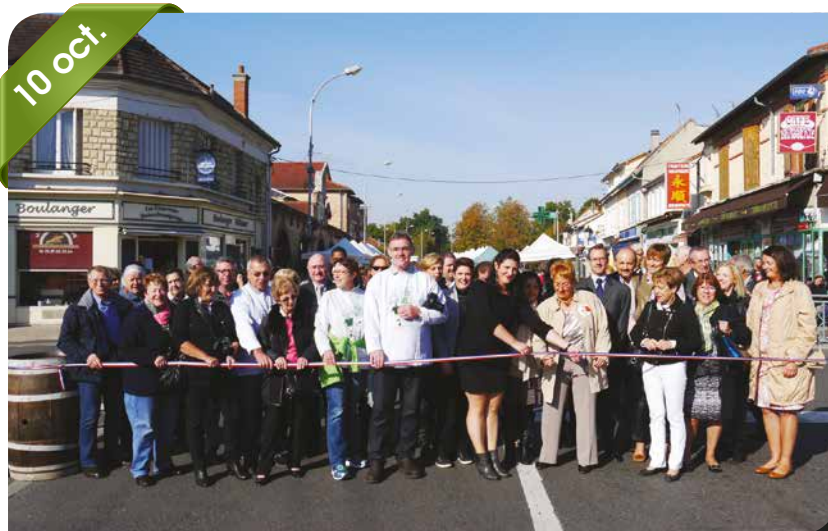
Fête des vendanges