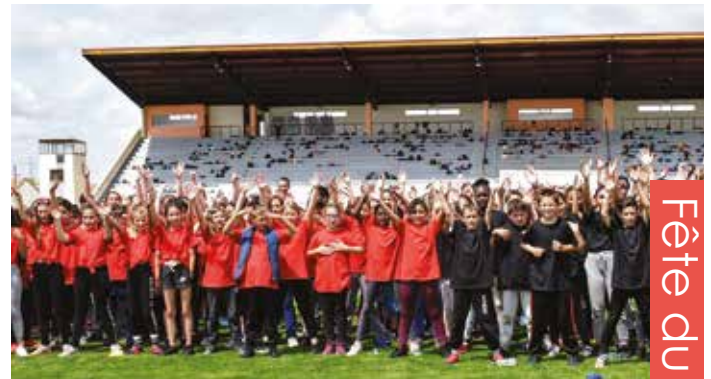
Fête du rugby 2018