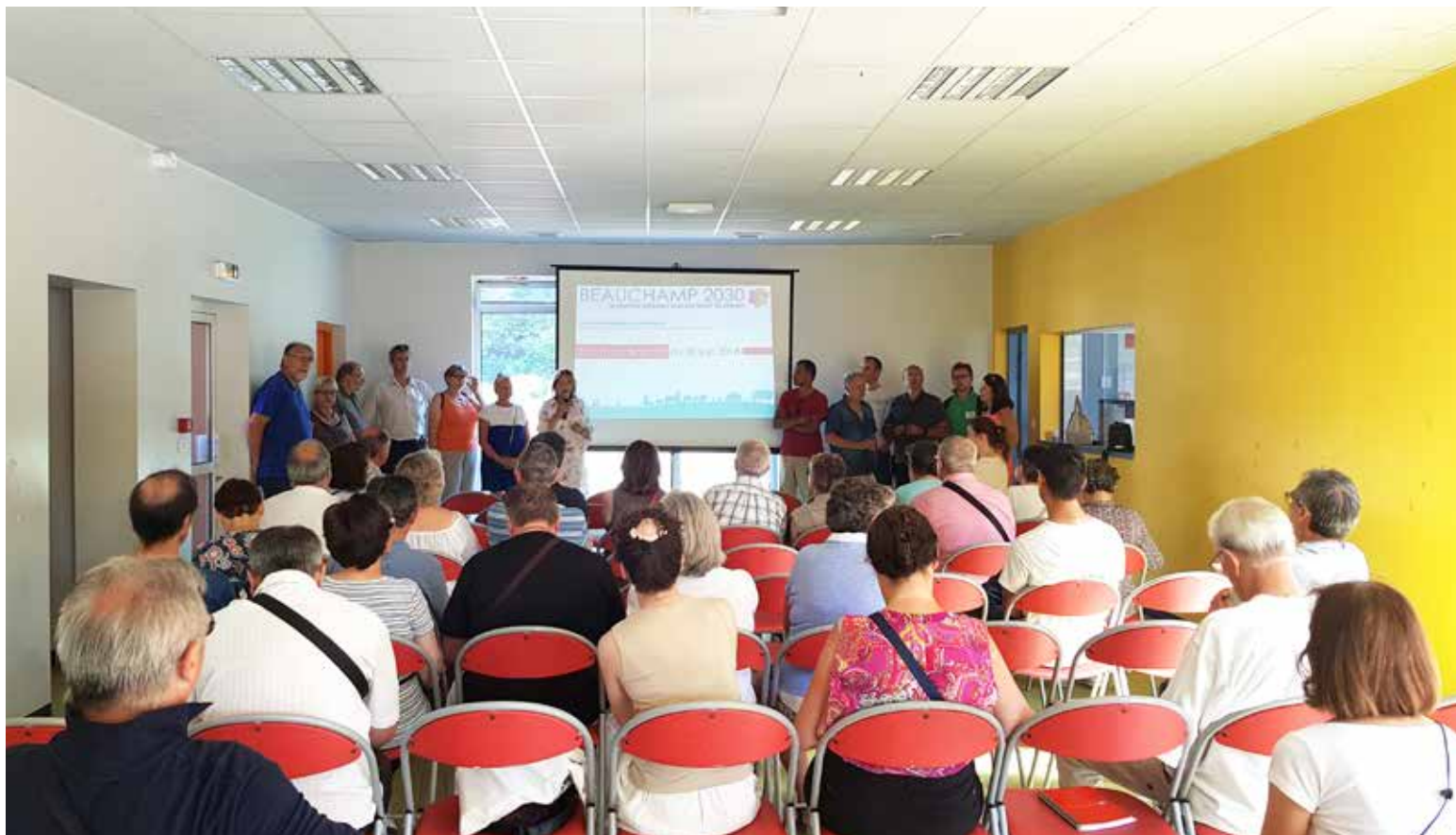
Le 30 juin, 80 personnes ont participé au 1 er forum des six quartiers organisé dans le cadre de l'étude urbaine.

En juin, deux temps de rencontres ont permis aux Beauchampois de prendre part à la réflexion sur le devenir de leur ville.