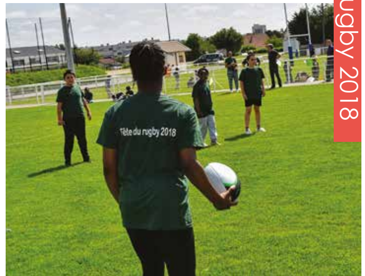
Le 15 juin, une rencontre intercommunale a rassemblé plus de mille élèves des classes de CM2 de Beauchamp, Bessancourt, St-Leu-la-Forêt, Taverny, Pierrelaye et Franconville.