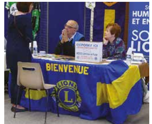
Forum des associations 2017