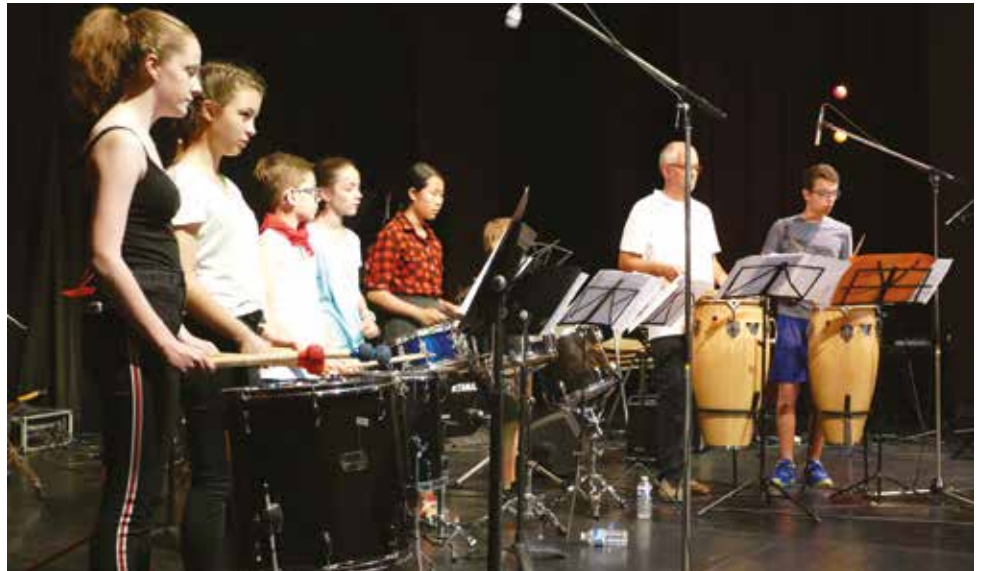
Concert de fin d'année de l'école municipale de musique.

Vous souhaitez faire de la musique ? Enfants, adolescents ou adultes, musiciens débutants ou non, classique, jazz ou rock, l'école municipale de musique vous accueille et vous propose des parcours adaptés.