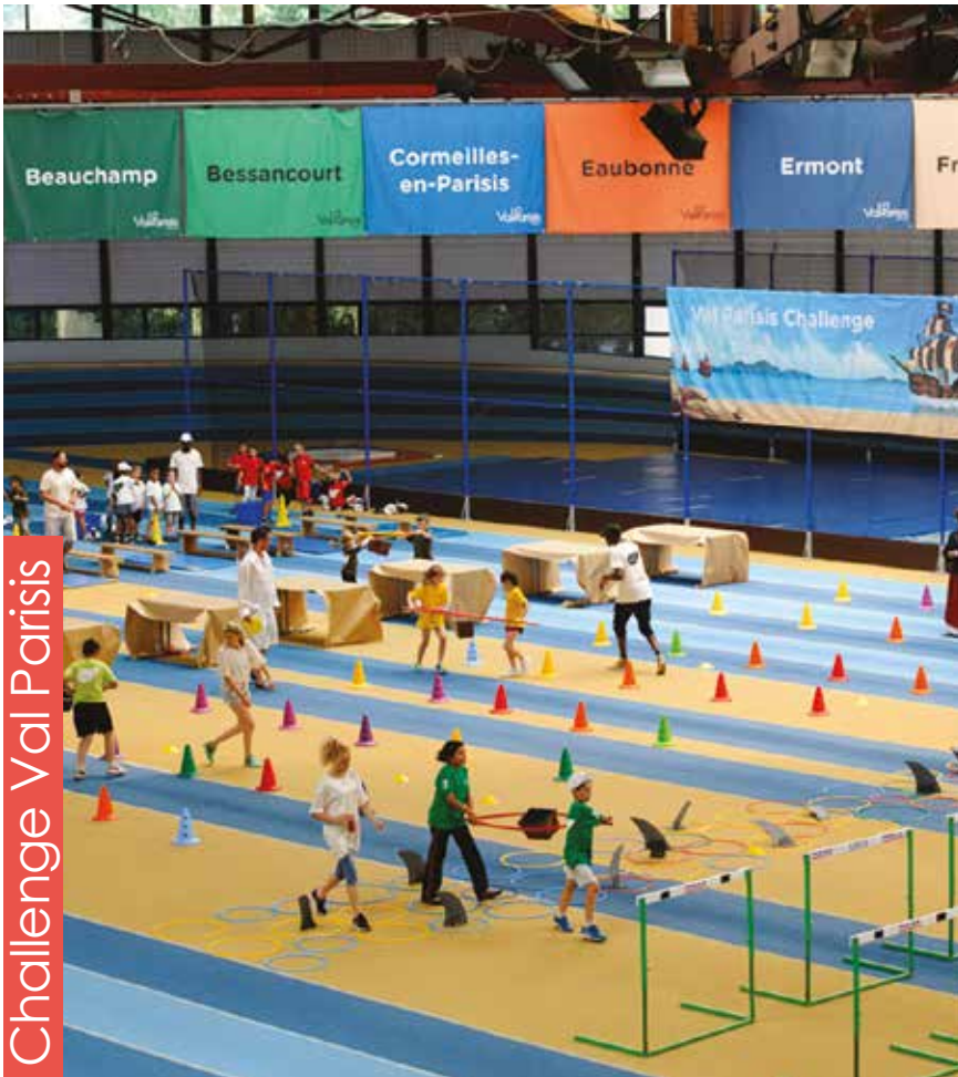
Challenge Val Parisis