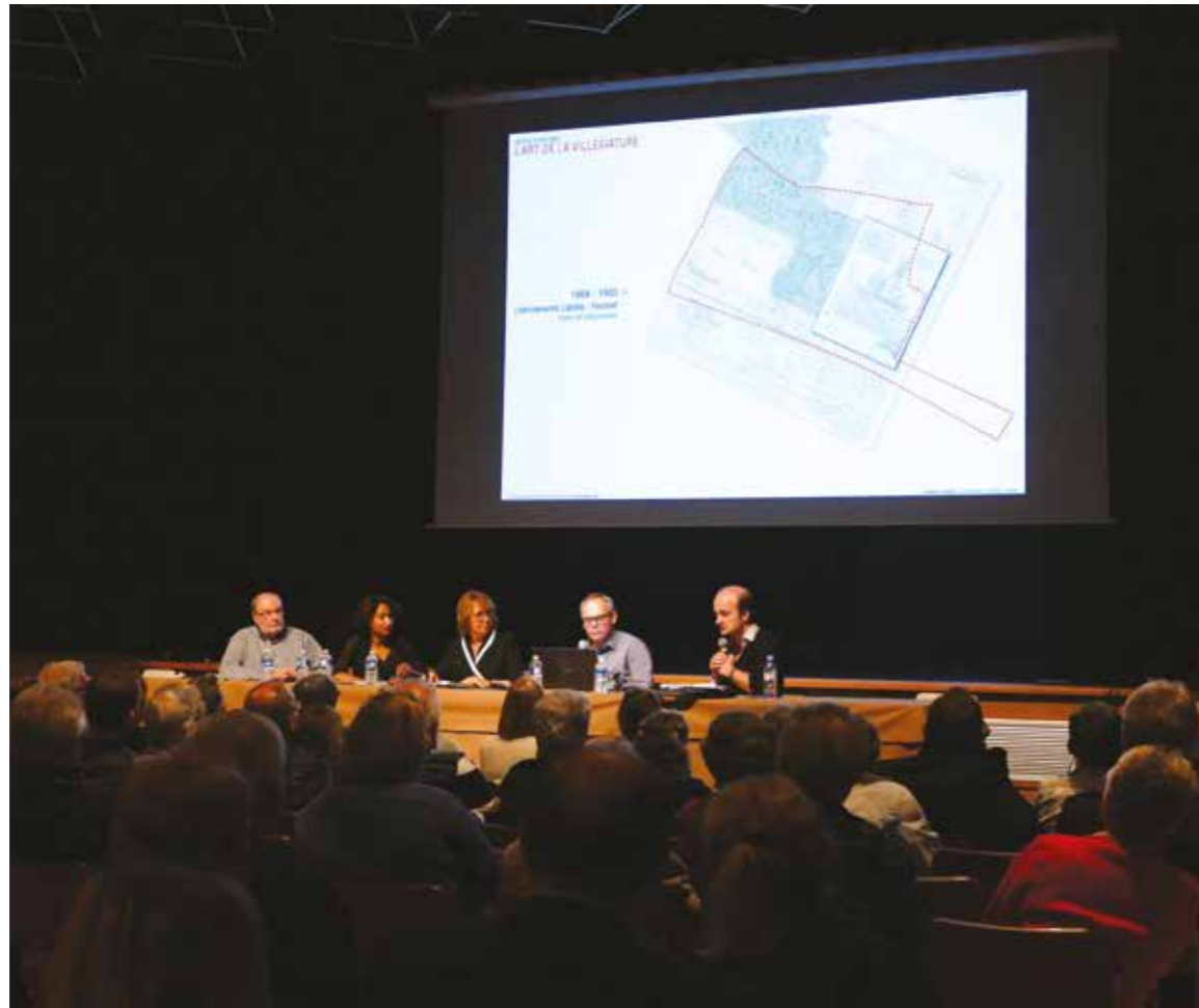
Près de 200 Beauchampois ont assisté à la réunion publique présentant les grandes orientations de Beauchamp 2030.