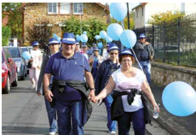
VENDREDI 12 OCTOBRE — MARCHÉ BLEUE — Après la signature de la Charte, les seniors ont parcouru une distance de 4 km pour arriver jusqu'au CCAS où une collation les attendait.