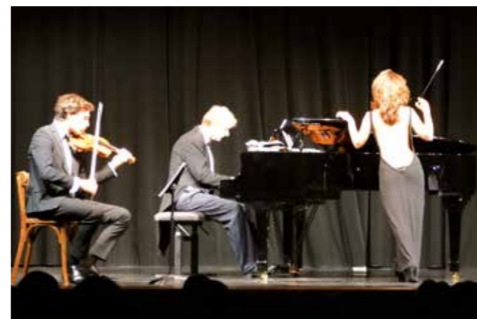
SAMEDI 29 SEPTEMBRE — Théâtre, les « Music'oz ».