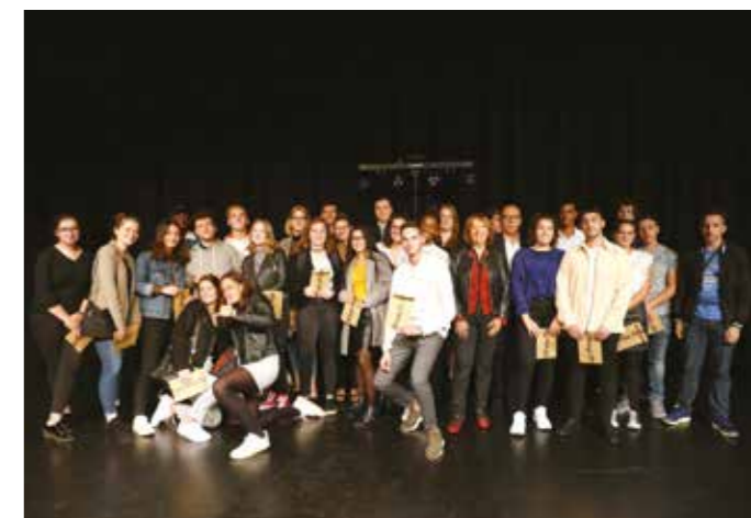
VENDREDI 19 OCTOBRE — Les jeunes diplômés ont été récompensés par la municipalité lors de la soirée des Lauréats.