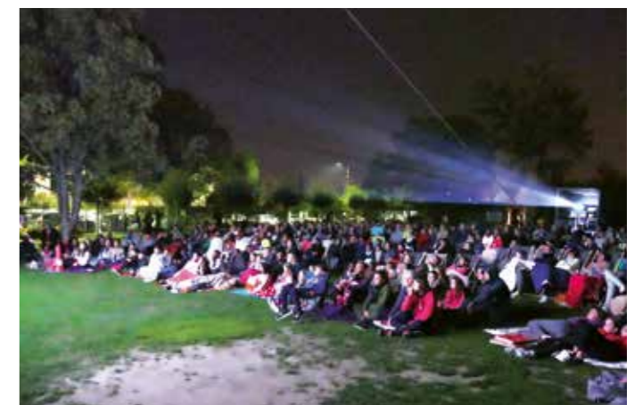
SAMEDI 15 SEPTEMBRE — Ciné en plein air au Parc arboré.