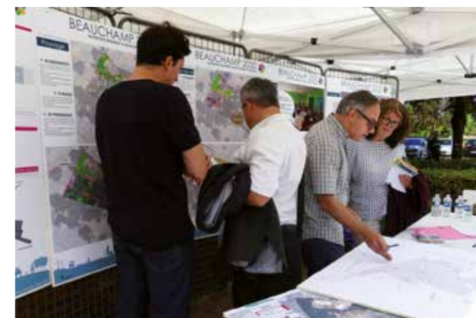
SAMEDI 8 SEPTEMBRE — Dans la continuité des échanges dans le cadre des ateliers du 30 juin, un stand d'informations « Beauchamp 2030 » a été mis à disposition lors du forum des associations.