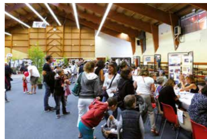
SAMEDI 8 SEPTEMBRE — Les Beauchampois sont venus nombreux lors du Forum des associations. Des activités et des démonstrations étaient proposées à cette occasion.