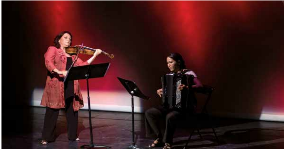
À l'occasion du Centenaire, concert, exposition, spectacle rythmeront les mois de novembre et décembre à Beauchamp.