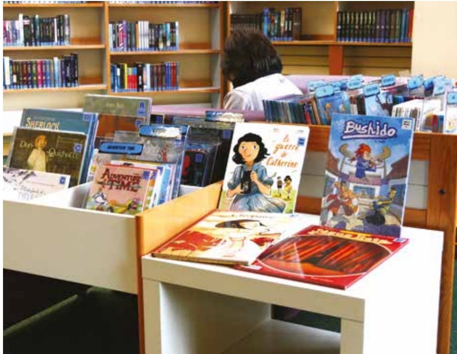
La bibliothèque Joseph Kessel fête ses 30 bougies et devient médiathèque.