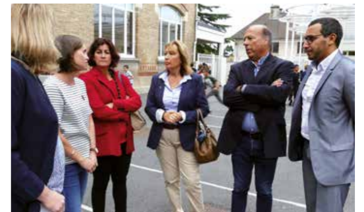
MARDI 4 SEPTEMBRE — Cécile Rilhac, députée, à l'école Paul Bert.