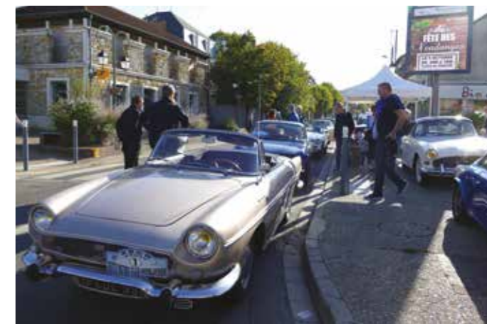
SAMEDI 6 OCTOBRE — Lors de la 23 e Fête des vendanges, des voitures anciennes étaient exposées par l'Auto Retro Club Herblaysien.