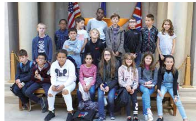
MERCREDI 3 OCTOBRE — CME - Visite du Mémorial de l'Armistice.