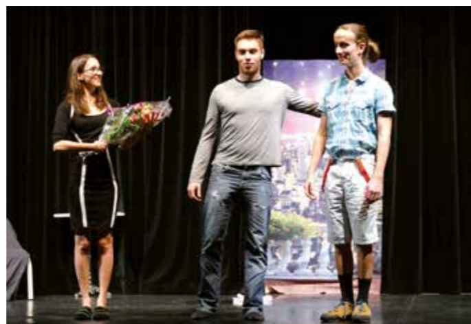
VENDREDI 12 OCTOBRE — THÉÂTRE — De jeunes comédiens ont interprété la pièce « Le pigeon sur le balcon » à la salle des fêtes de Beauchamp.