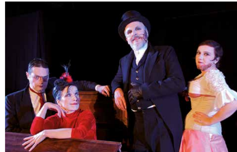
Samedi 24 novembre, spectacle « Le petit cabaret des gueules cassées ».

Rens. M me LATHUILLIERE au 01 34 12 24 73