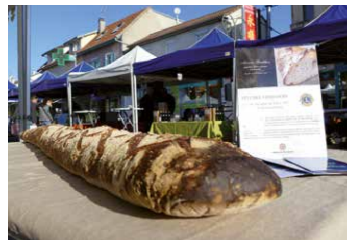
SAMEDI 6 OCTOBRE — La maison Gauthier a créé ce pain géant afin de soutenir l'association « Le LIONS Club de Beauchamp ». Cette association a pour but de venir en aide aux malvoyants, aux handicapés et à la jeunesse.