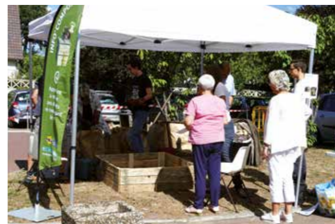
SAMEDI 8 SEPTEMBRE — Lors du Forum des associations, Tri-Action a proposé une animation afin de créer un potager en lasagnes.