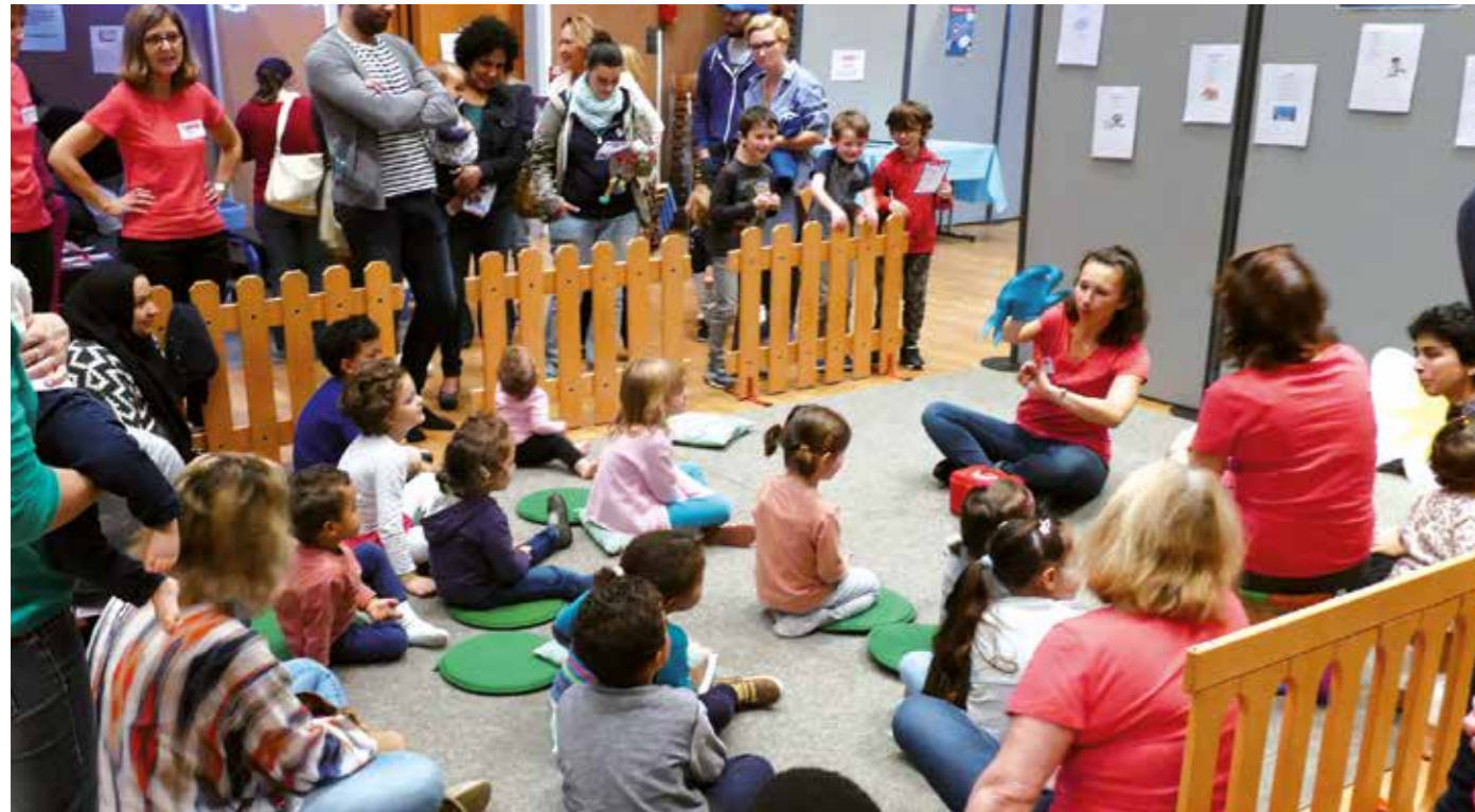
Une matinée jeu pour les 0-5 ans est organisée à la salle des Fêtes dans le cadre des Semaines de la Parentalité qui se déroulent du 7 au 21 novembre.

Du 7 au 21 novembre, la commune organise pour la première fois les Semaines de la parentalité sur le thème national « Être parent, une aventure ».