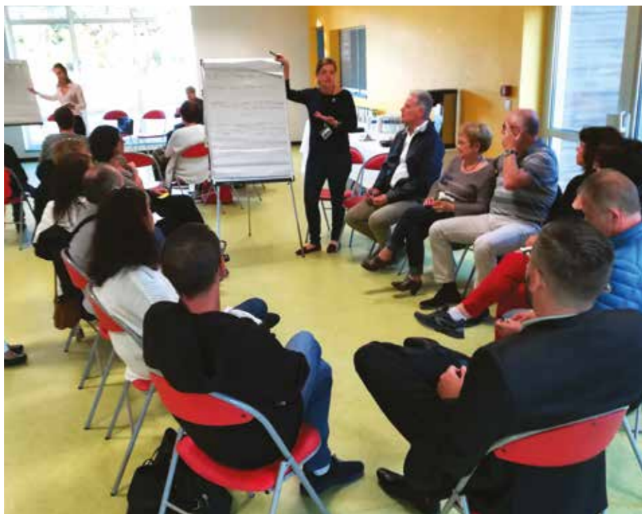
Une rencontre CCI et commerçants a été organisée à l'initiative de la commune.