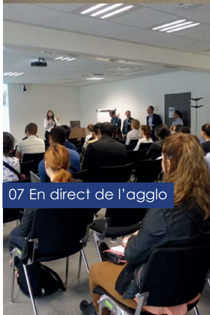
07 En direct de l'aggl