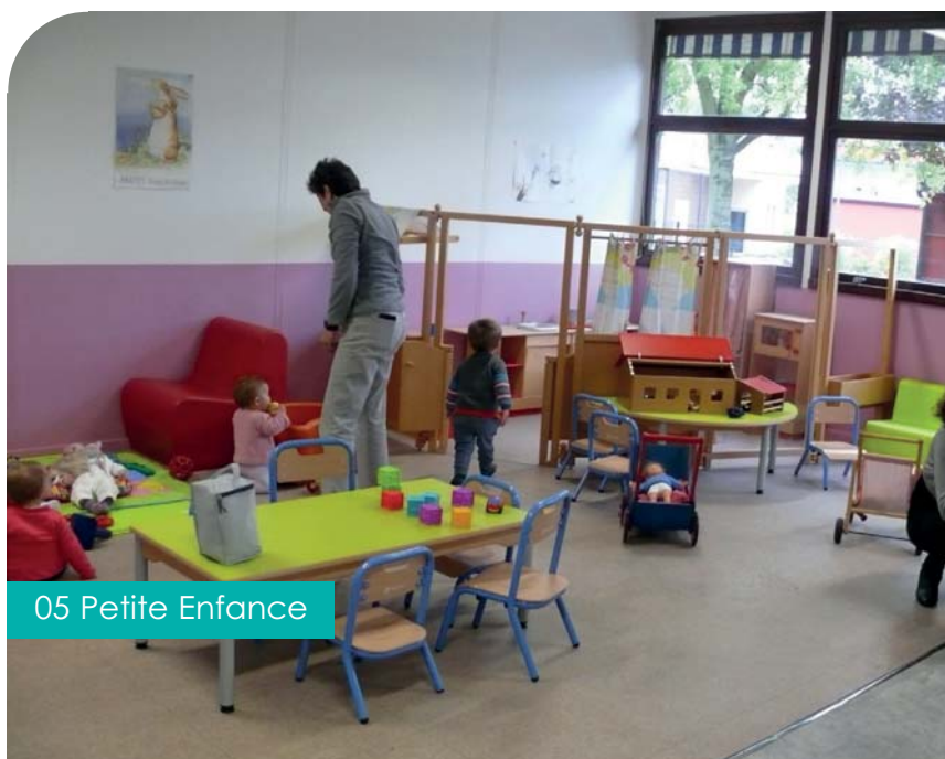
05 Petite Enfance