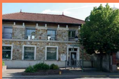
128 bis, Chaussée Jules César.

A compter du 17 novembre 2016, vous retrouverez votre Centre Communal d'Action Sociale à l'Espace Jules César,