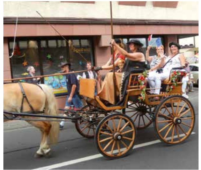
Le 25 juin - Grand défilé haut en couleurs dans les rues d'Altenstadt