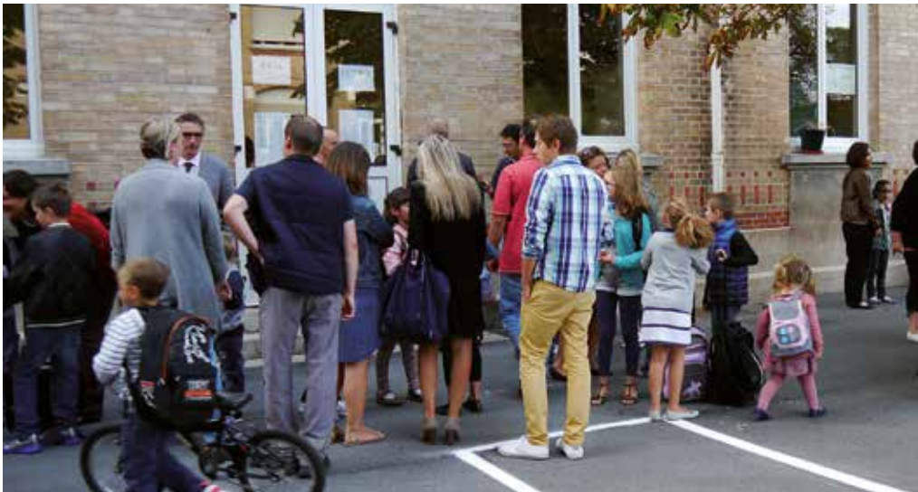
Cette rentrée est marquée par le retour de la semaine de 4 jours à Beauchamp.

À la demande des conseils d'école, Beauchamp a dit oui au retour à la semaine de 4 jours dès la rentrée 2017.