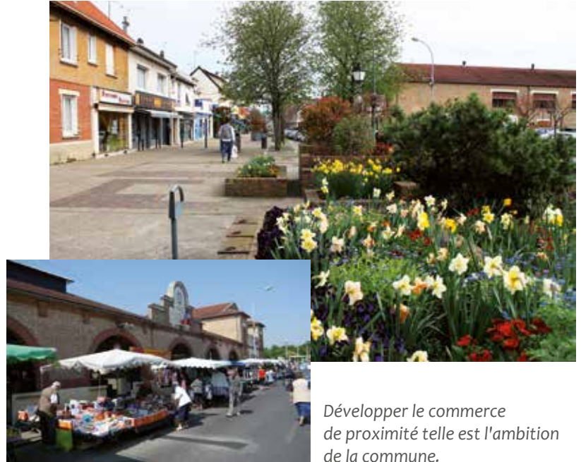
Développer le commerce de proximité telle est l'ambition de la commune.

De ce constat, un plan d'actions sera élaboré en collaboration avec la commune et les commerçants afin de définir une stratégie de développement en prenant en compte le contexte social,