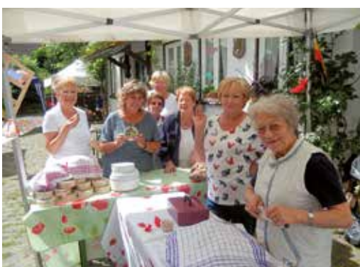
Vente de produits français par le Comité de jumelage Altenstadt-Beauchamp.