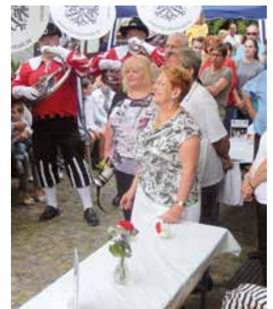
Visite de la Fanfare d'Altenstadt sur les stands du Comité.