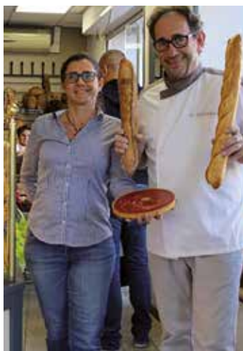
147, chaussée Jules-César. Tel. 01.39.60.33.64.