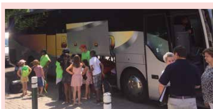
Dans le cadre du partenariat entre le CCAS et le Lions Club de Beauchamp/Taverny, 5 enfants de Beauchamp sont partis du 8 au 15 juillet en vacances au chalet d'Etueffont à Saint-Etienne lès Remiremont.