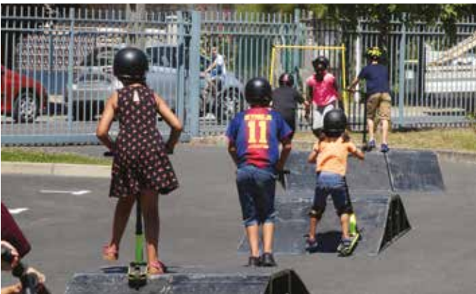
BEAUCHAMP'ESTIVAL – Animation trottinettes.