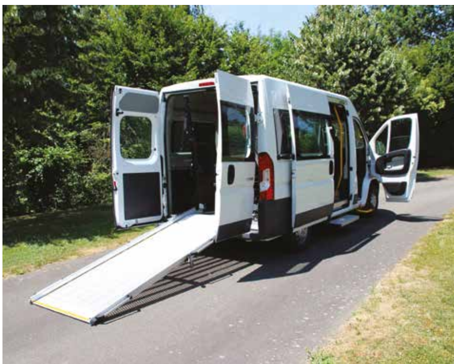
Le nouveau P'ti bus est adapté au transport des personnes à mobilité réduite.