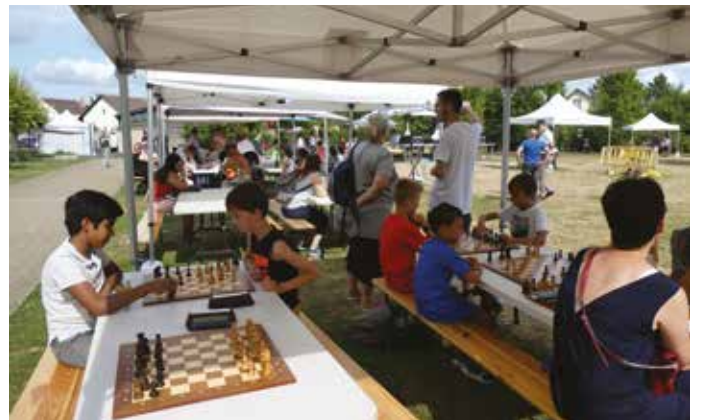
BEAUCHAMP'ESTIVAL – Ateliers échecs.