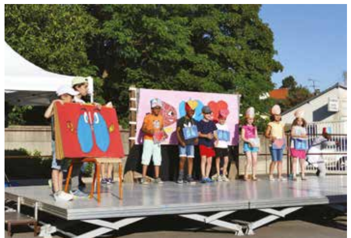
MERCREDI 3 JUILLET — Grand spectacle de clôture de l'année scolaire au centre de loisirs sur le thème du Children Show.