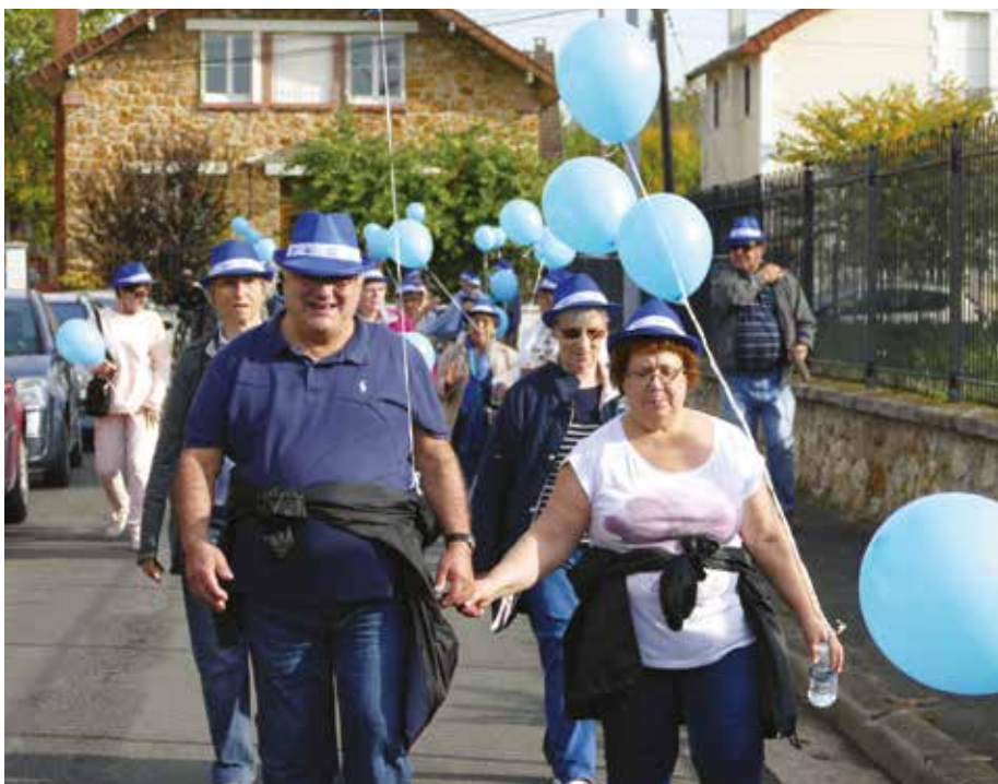
La traditionnelle marche bleue et une animation musicale clôtureront cette semaine dédiée aux seniors.