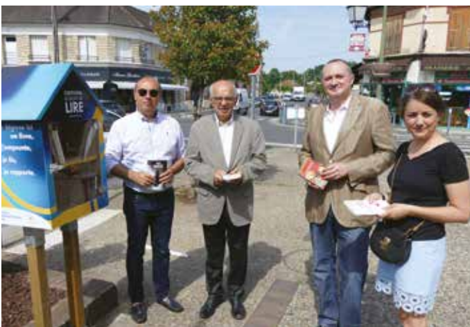
MARDI 25 JUIN — Installation d'une boîte à livres dans le centre-ville de Beauchamp offerte par le Lion's Club.