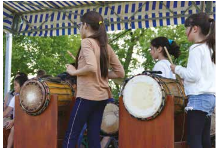
VENDREDI 21 JUIN — Les élèves de l'école de musique ont ouvert le spectacle avec notamment la formation percussions.