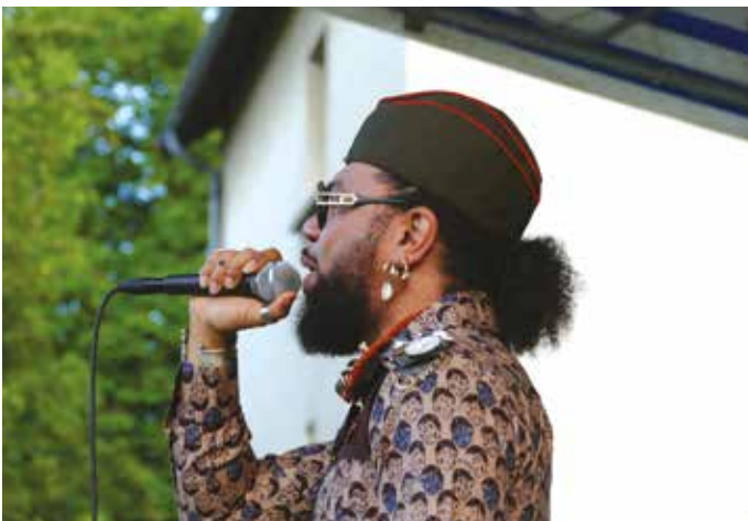
VENDREDI 21 JUIN — Nouvelle fête de la musique dans le Parc de la Mairie avec Jaja en concert de clôture.