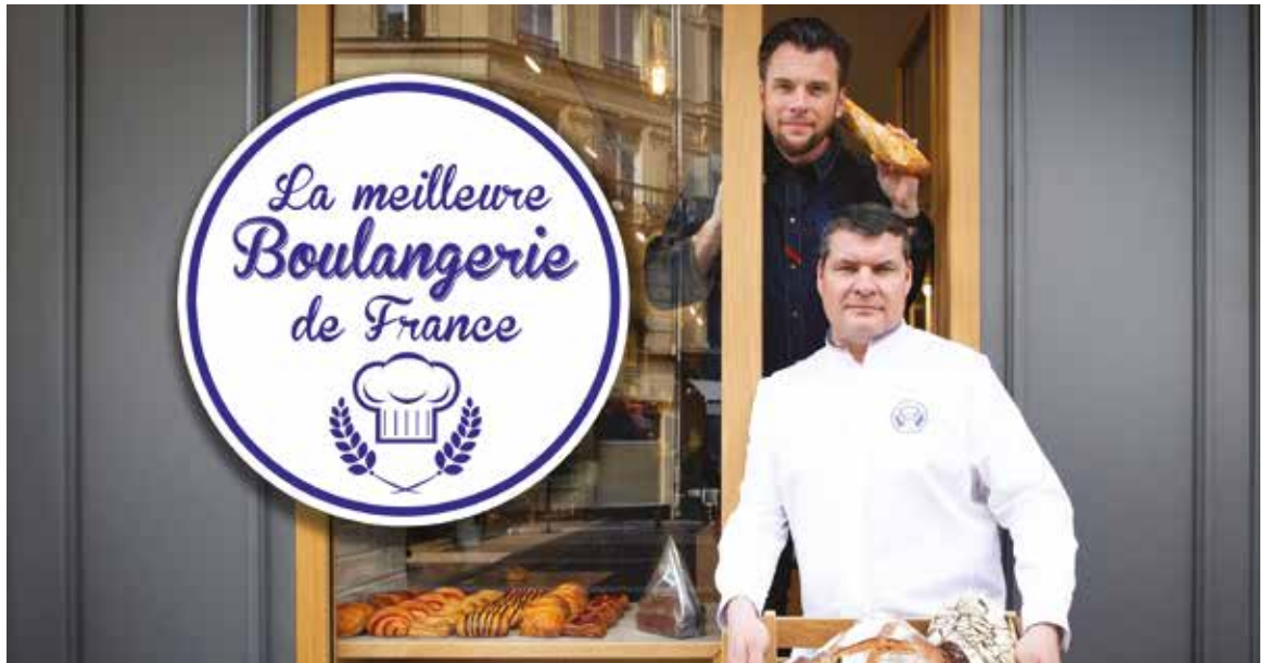
La boulangerie Gauthier a participé à l'émission télévisée la Meilleure boulangerie de France