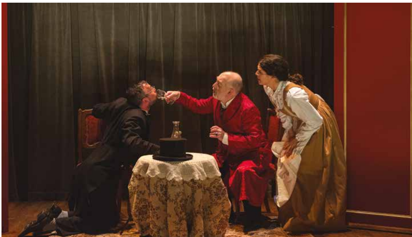
La Demande en mariage et L'Ours, deux farces de Tchekhov présentées par le Théâtre de l'Usine.

La nouvelle saison culturelle sera accessible à tous avec la volonté de diversifier les propositions avec de nouveaux partenaires comme le Théâtre de l'Usine.