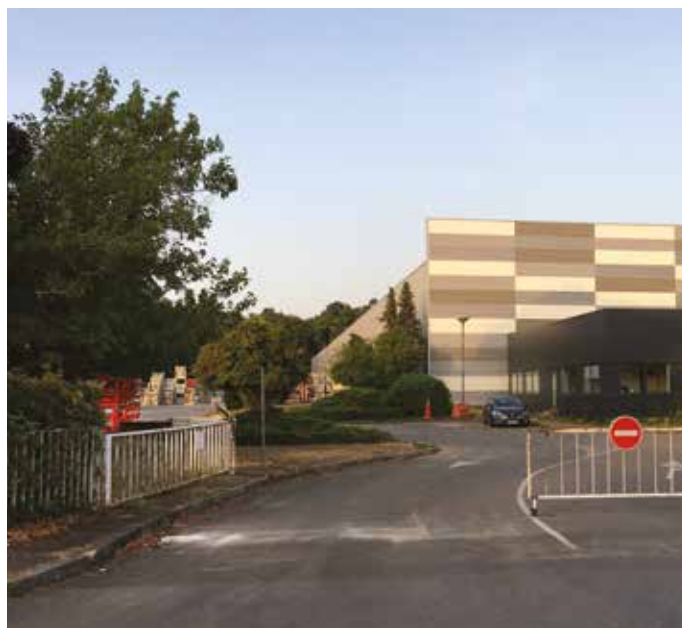
Le siège de Copac est désormais situé dans la zone d'activités.

Société COPAC - 65 ter Chaussée Jules César Tél. 01 30 30 71.71 www.copac.fr