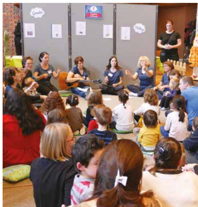
La matinée jeu change de format et devient la journée des familles.