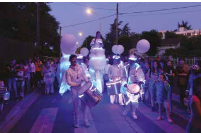
13 JUILLET – Défilé avec la batucada Tewhoola.