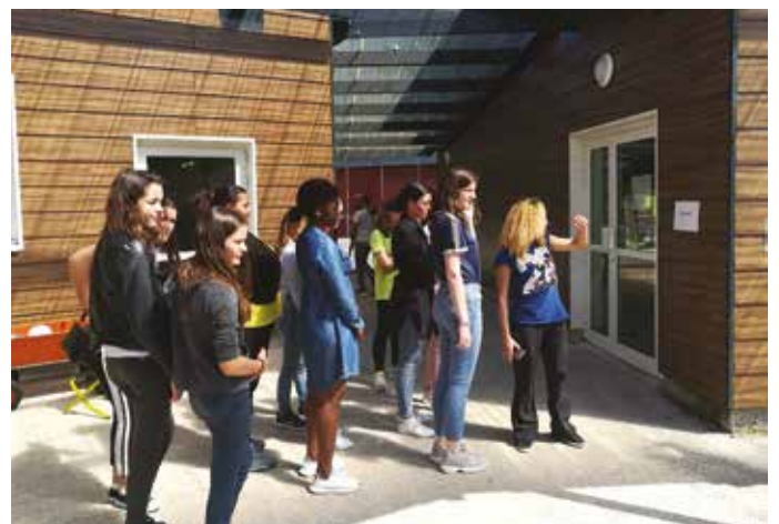
DU 1 ER AU 4 JUILLET — Le PIJ a organisé un stage baby-sitting auquel ont participé onze jeunes filles.