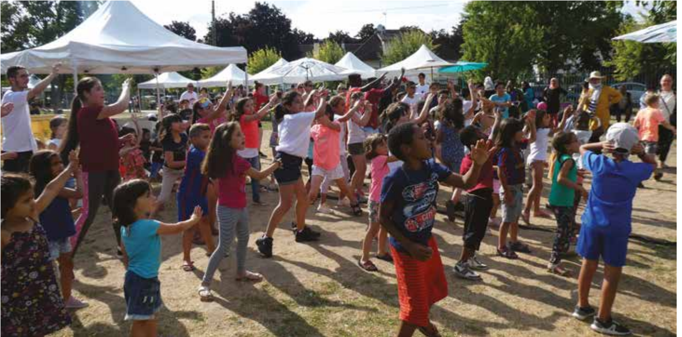
BEAUCHAMP'ESTIVAL – Danses et animations ont rythmé cette 3 e édition du Beauchamp'Estival.

Retrouvez toutes les manifestations en images sur le site de la commune www.ville-beauchamp.fr et sur le Facebook de Beauchamp.