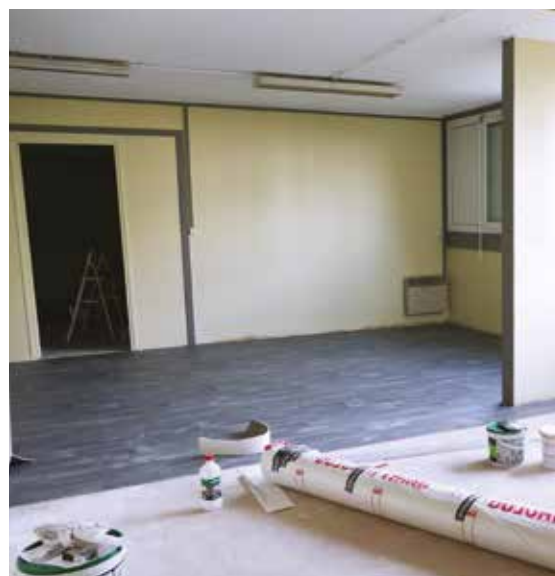
Le local en cours de rénovation.

Les résidents seront sollicités prochainement pour l'émergence de nouvelles actions en partenariat avec les professionnels communaux et associatifs.