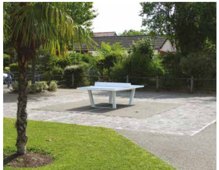
Une première table de ping-pong a été installée au parc arboré.

A partir du mois de septembre, les conseils de quartier sont suspendus en raison de la période pré-électorale. Les référents restent joignables.