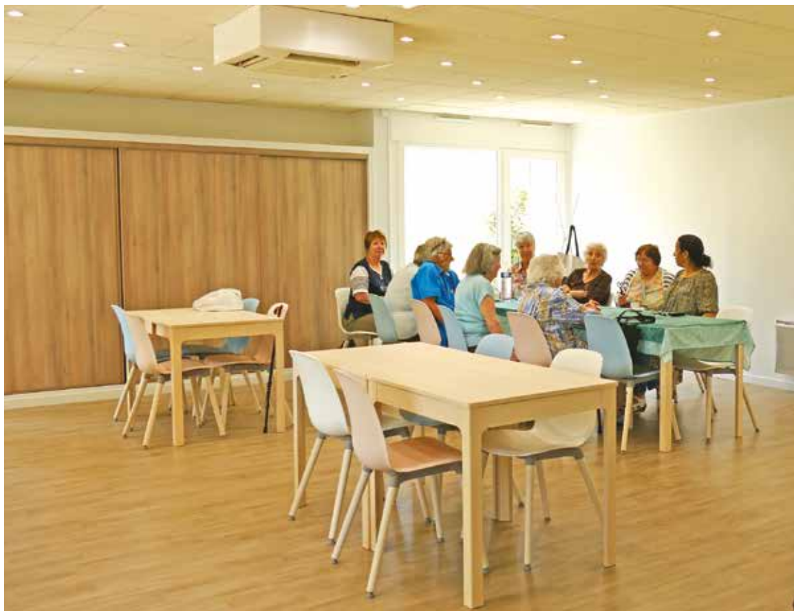
Les résidents sont indépendants tout en bénéficiant d'espaces communs.