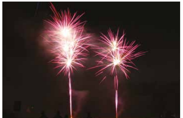
13 JUILLET – Feu d'artifice sur le thème du Premier pas sur la lune.