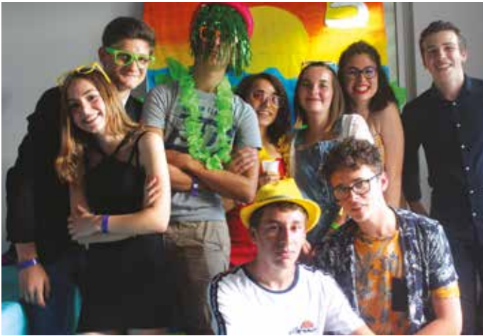
VENDREDI 28 JUIN — Pour clôturer l'année scolaire, le PIJ et le service jeunesse ont organisé le traditionnel bal des collégiens