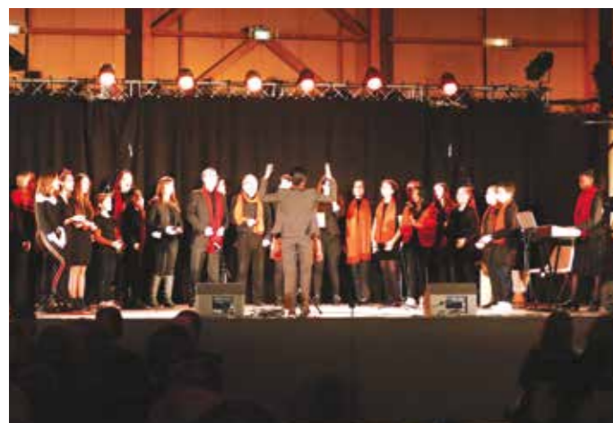
VENDREDI 17 JANVIER — Vœux du Maire — Avec la participation de Jazz n' Gospel et de la chorale du collège Montesquieu.