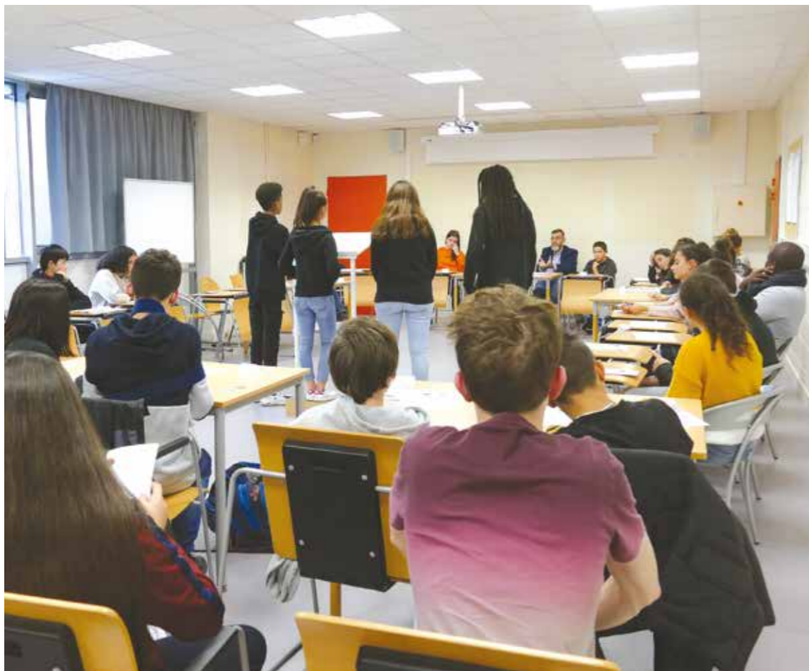
Afin de les sensibiliser aux conduites à risque, les jeunes sont confrontés à la réalité d'un procès véritablement jugé.