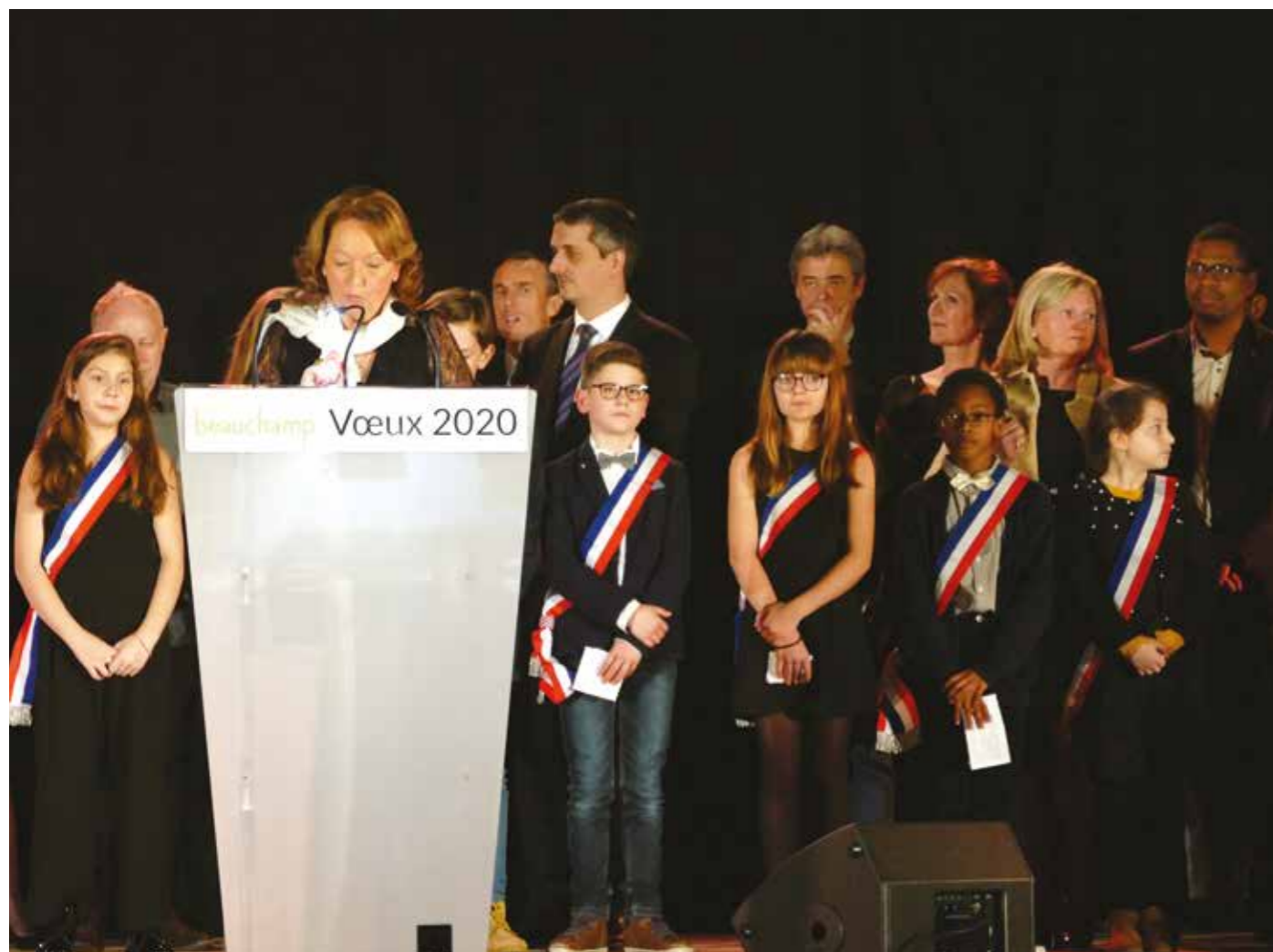
VENDREDI 17 JANVIER — Vœux du Maire — A l'occasion de la traditionnelle cérémonie des vœux du Maire, les jeunes du Conseil municipal des enfants ont fait le bilan de leur mandat d'élus en herbe.

Retrouvez toutes les manifestations en images sur le site de la commune www.ville-beauchamp.fr et sur le Facebook de Beauchamp.