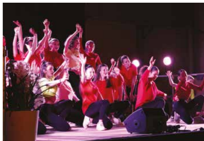
VENDREDI 17 JANVIER — Vœux du Maire — Avec la participation des associations de danse ALB et UFAU.