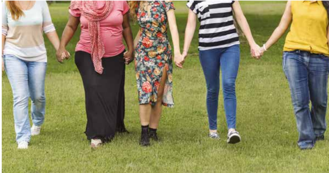
La femme est mise à l'honneur par le CCAS à l'occasion de la journée internationale qui lui est dédiée chaque année.