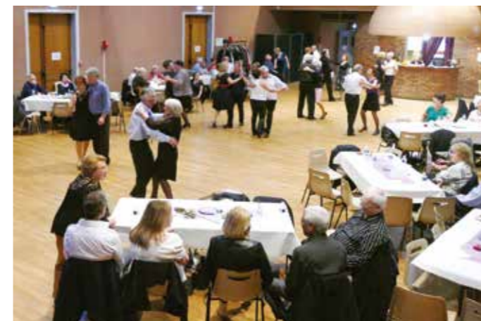
DIMANCHE 2 FÉVRIER — Premier thé dansant de l'année.