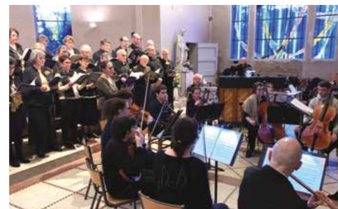
DIMANCHE 19 JANVIER — Concert du Nouvel An de l'école municipale de musique.