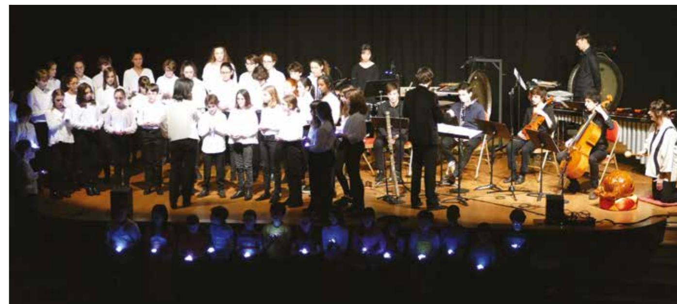
SAMEDI 25 JANVIER — Représentation du Conte lyrique « Métamorphoses du Serpent blanc », à la salle des fêtes.